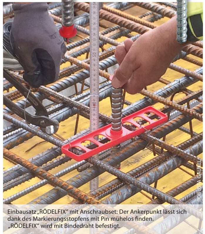
Einbausatz „RÖDELFIX“ mit Anschraubset: Der Ankerpunkt lässt sich dank des Markierungsstopfens mit Pin mühelos finden. „RÖDELFIX“ wird mit Bindedraht befestigt.